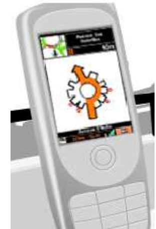
se déplacer par GPS