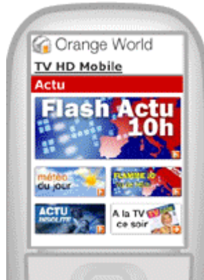
regarder la TV sur son mobile