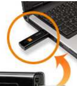
naviguer en haut débit en nomadisme

Internet, où je veux, quand je veux, depuis mon ordinateur portable.