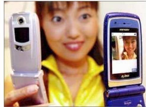
communiquer en visiophonie