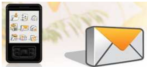
lire ses mails sur son mobile

Internet, où je veux, quand je veux, depuis mon ordinateur portable.