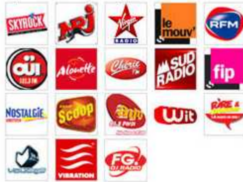
écouter la radio